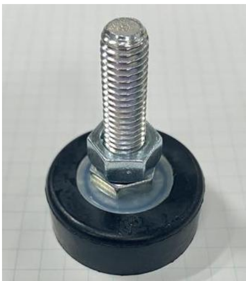
【変更前】 保護カバー無